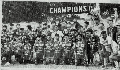
Foto bersama tim Persikopa usai memenangkan pertandingan.

Sebelumnya, Persikopa bermain dengan hasil sempurna