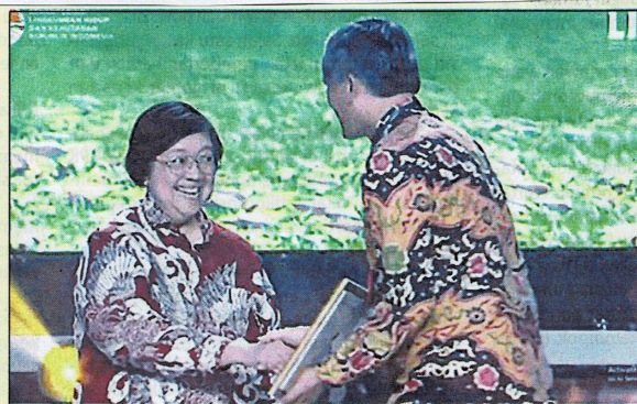
PJ. WAKO Pariaman saat menerima penghargaan Proklim dari Menteri LHK RI

Program Kampung Iklim yang telah berjalan sejak 2012 terus menunjukkan perkembangan positif dengan lebih dari 10.000 lokasi di seluruh Indonesia. Kota Pariaman menjadi salah satu daerah yang aktif dalam mendukung program ini, sebagai wujud nyata kepedulian terhadap ke-